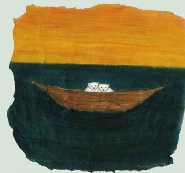
《From here to somewhere》