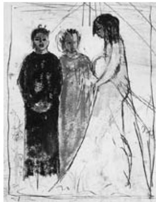
図17《信仰》 福島県立美術館蔵