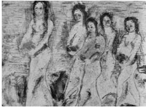
図15《信仰の悲しみ》下絵