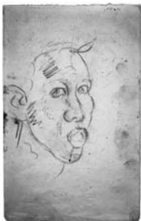
図32 《スケッチブック 顔》 三重県立美術館蔵