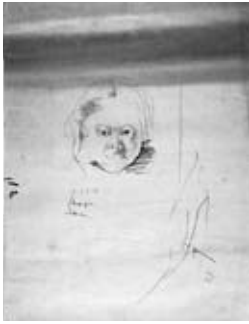
図3 《少年》 個人蔵