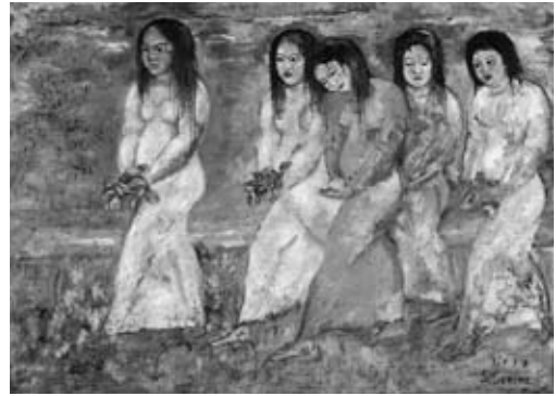
図14《信仰の悲しみ》 大原美術館蔵