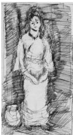
図24 《女の立像》 長野県信濃美術館蔵