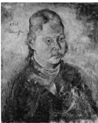
図26 《小供》 個人蔵