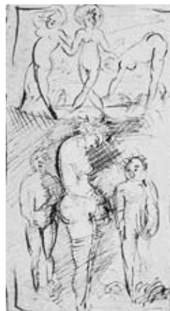
図20 《裸婦群像》 長野県信濃美術館蔵