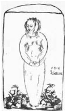
図7 《病める者》 『文章世界』13巻11号