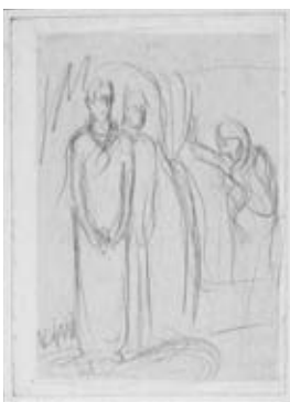
図18《折り》 福島県立美術館蔵