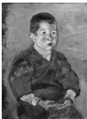
図25 《子供》 石橋財団アーティゾン美術館蔵