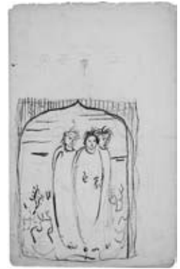
図11《文章世界表紙下絵》 三重県立美術館蔵