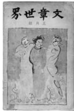
図10《無題》 『文章世界』14巻3号表紙