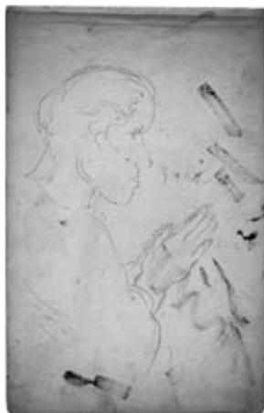
図31 《スケッチブック 合掌する男》 三重県立美術館蔵