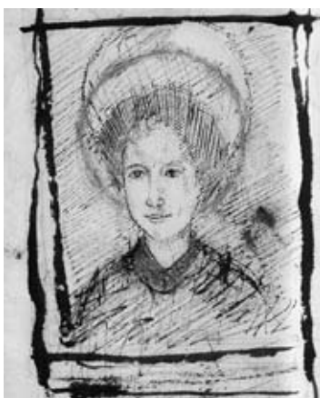
図34 《女の顔》 神奈川県立近代美術館蔵