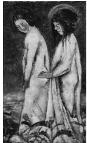
図16《神の折り》 福島県立美術館蔵