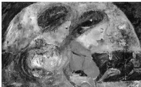
図27 《三人の顔》 ポーラ美術館蔵