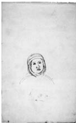
図12 《スケッチブック 包帯の男》 三重県立美術館蔵