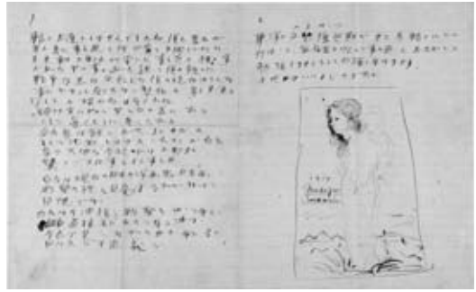
図1 村岡黒影宛書簡 1918年5月20日 福島県立美術館蔵