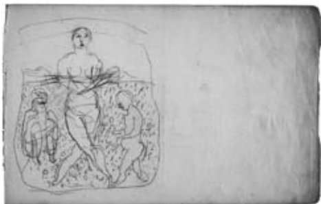
図21 《三人（野原）》 三重県立美術館蔵