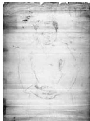
図29 《少年座像》 個人蔵