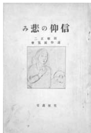
図33 『信仰の悲み 関根正二遺作展目録』 右 表紙 左 出品目録