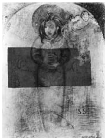
図23 《天使（断片）》 三重県立美術館蔵