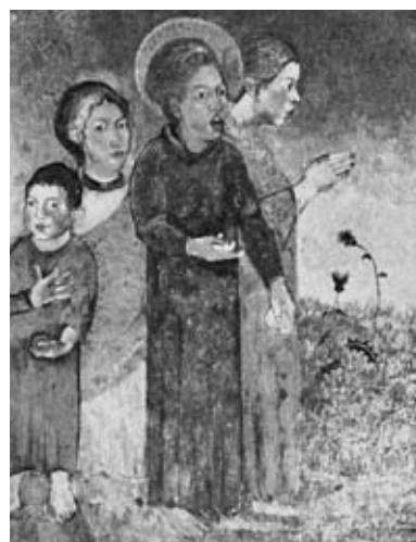
図30 《慰められつゝ悩む》 (絵はがき)