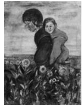
図4 《姉弟》 福島県立美術館蔵