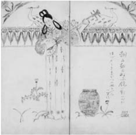
図13《天平美人》 大阪中之島美術館蔵