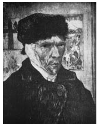
図9 ゴッホ 《自画像 耳を繙帯せる》 『現代の洋畫』17号 白黒図版