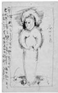
図5 村岡黒影宛葉書 1918年7月3日 福島県立美術館蔵