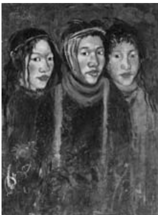
図8 《三星》 東京国立近代美術館蔵