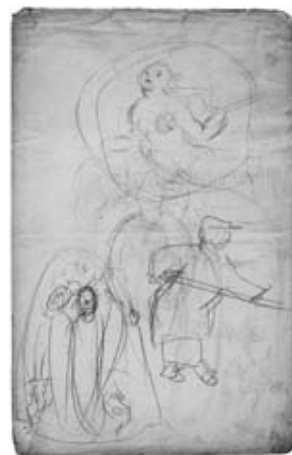
図22 《走る女と表紙下絵》 三重県立美術館蔵