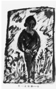
図6 《女》 『文章世界』13巻6号