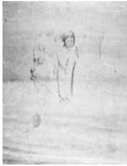
図2 《子守する女と横顔》 個人蔵