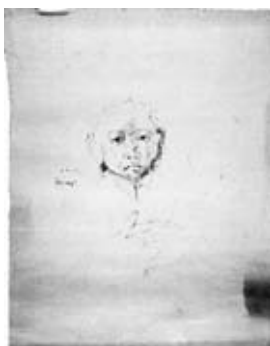
図28 《手を合わせる少年》 個人蔵