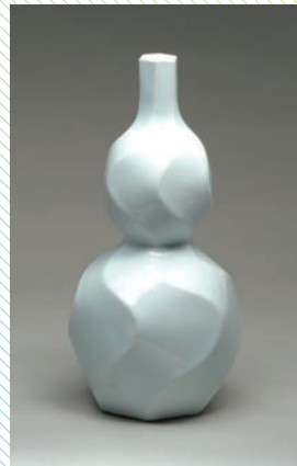
一重孔希《白磁瓢形花瓶》制作年不詳