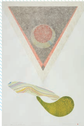
小島安男《隠された球体(A)》1997年