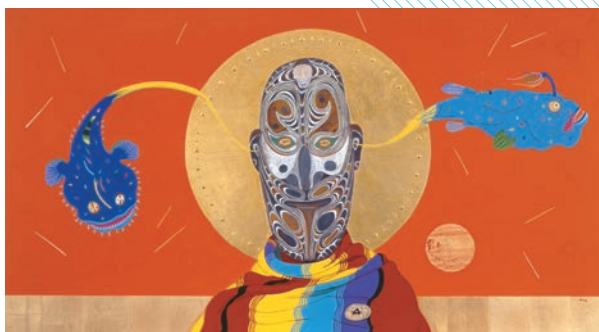
峰丘《パパアの聖人になった自画像から抜け出してゆく私とあなた》2011年