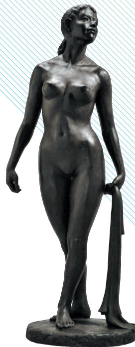
遠藤徳《古里・帰還の日》2017年