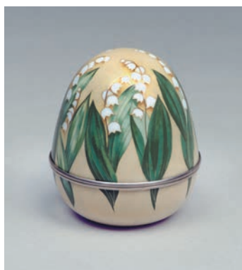
水落侂子《有線七宝香合「きみかけそう」》2007年