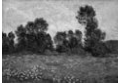
クロード・モネ 《ジュヴェルニエの草原》1890年

1984年7月に開館した福島県立美術館は今年40周年を迎えます。当初600点にも満たなかったコレクションは、その後の活動のなかで数を増やしていき、現在は4,000点以上に上ります。