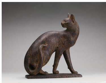
佐藤玄々(朝山)《牝猫》1928年 横井美恵子コレクション