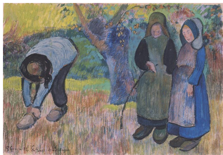
ポール・ゴーガン《ブルターニュの子供》1889年