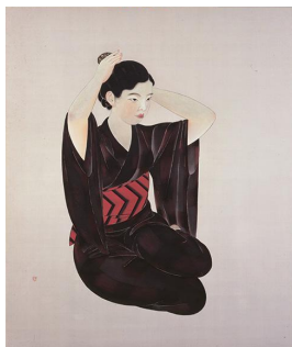
速水御舟《女二題 其二》1931年