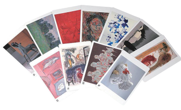
福島県立美術館アートカード