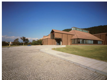
福島県立美術館 外観