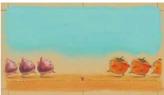
未完「ふゆのおとずれ」