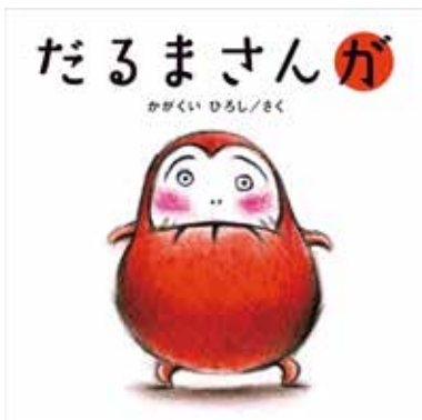
『だるまさんが』2008年 ブロンズ新社

絵本作家として活動したのはわずか4年だけでしたが、かがくいの中にはアイデアが溢れるほどに詰まっていた。4年間でなんと16作品（没後刊行含む）、驚異的なスピードで描き、世に送り出した絵本は、どれ一つ絶版になることなく、今も読み継がれています。