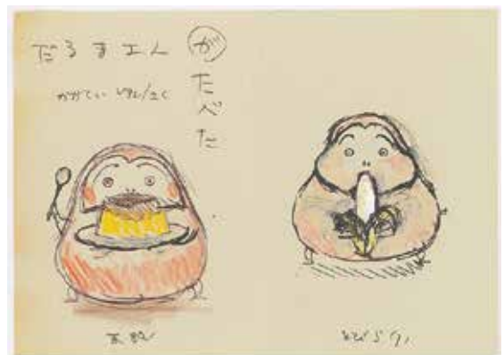
未完「だるまさんがたべた」

「あと3年は（絵本にできる）ネタがあるよ」と語っていたかがくい。だるまさんやまくらのせんになん続編をはじめ、数々のおもしろい構想をラフ・習作としてのこしています。会場でしか目にすることができない未完の絵本の卵たちに、会いに来てください。