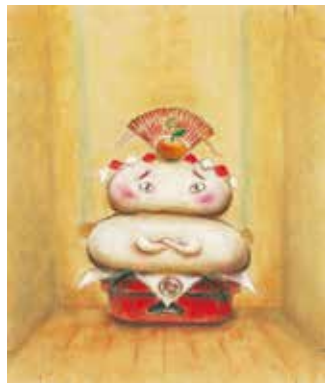
『おもちのきもち』原画 2004-05年 ©Hiroshi Kagakui/KODANSHA